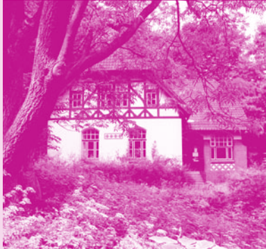
Literaturhaus S-H Alter Botanischer Garten Kiel, Schwanenweg 13