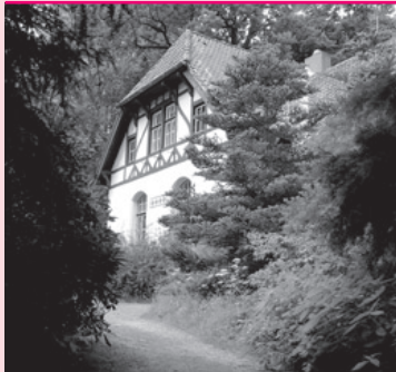
Literaturhaus S-H Alter Botanischer Garten Kiel, Schwanenweg 13