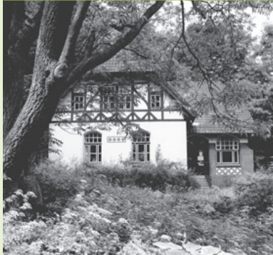
Literaturhaus S-H Alter Botanischer Garten Kiel, Schwanenweg 13