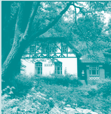
Literaturhaus S-H Alter Botanischer Garten Kiel, Schwanenweg 13