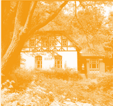
Literaturhaus S-H Alter Botanischer Garten Kiel, Schwanenweg 13