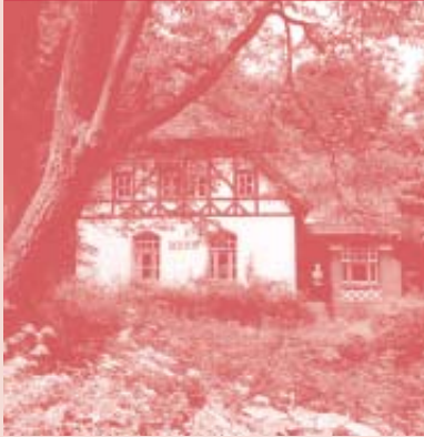
Literaturhaus S-H Alter Botanischer Garten Kiel, Schwanenweg 13