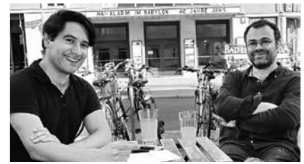
Hauck & Bauer