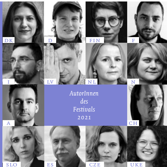
AutorInnen des Festivals 2021