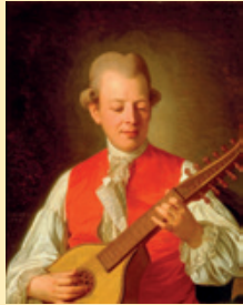
CARL MICHAEL BELLMAN